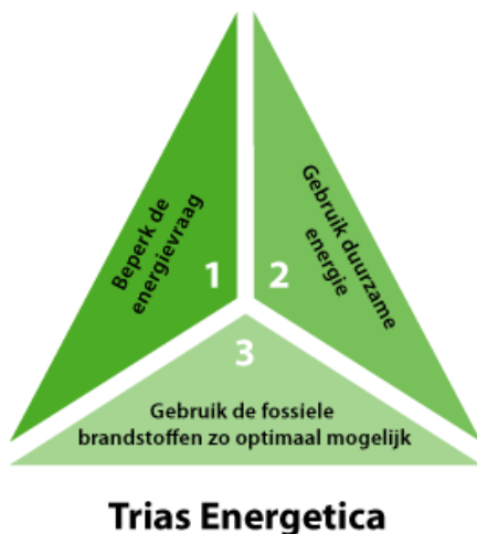
Figuur 1: Tria's Energetica

Het viertal werkt vanuit de tria's Energetica (zie afbeelding 1) en richt zich voornamelijk op het 1) beperken, 2) duurzaam opwekken en 3) verminderen van energieverbruik in de wijk door bewoners.